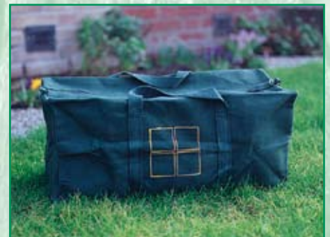
Tasche für den Mini-Profi