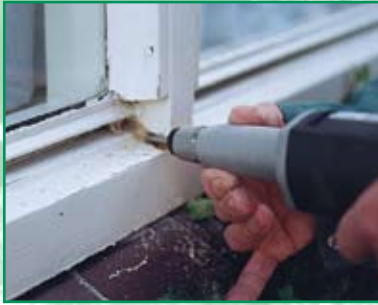
Aufweiten von Verbindungen Außenseite