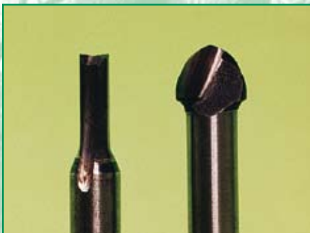
Schaftfräser für Gebrauch innen und Kugelkopffräser für außen