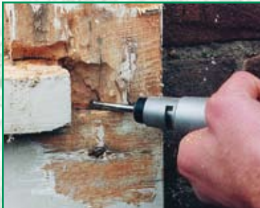
Entfernen von zu weichem, ver- wittertem, beschädigtem Holz