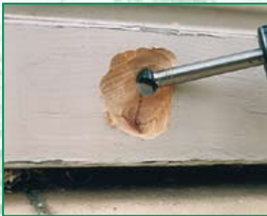
Entfernen von losen Aststellen