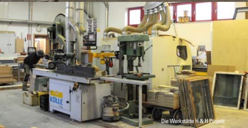
Die Werkstätte H & H Projekt

raturen, Schichtstärken und Modellierungseigenschaften sind gut auf unsere Arbeiten abgestimmt.“ Kuhlmann weiter: “Dank umfassender Produktinformationen und Fachberatung auch vor Ort, dem schnellen Lieferservice durch die MEGA, Malereinkauf Pampow, und dem ständigen Bemühen bei Repair Care, sich weiter zu entwickeln, werden noch viele Kunden aus dem öffentlichen oder privaten Bereich zu den Produkten der Firma Repair Care finden.“