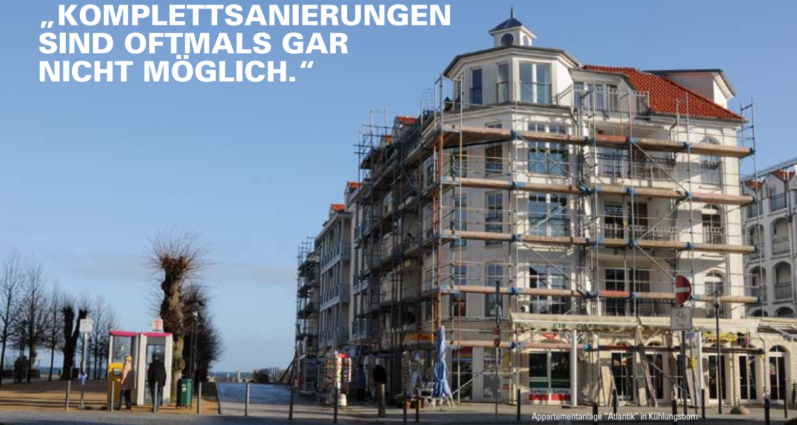
Appartementsanlage "Atlantik" in Kühlungsborn